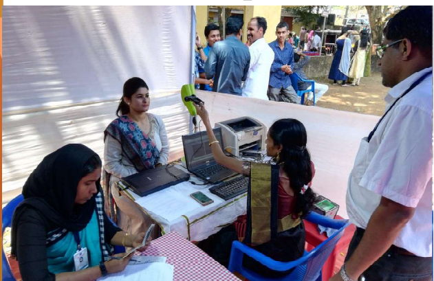
മലപ്പുറം കളക്ട്രേറ്റ് ഗ്രൗണ്ടിൽ നടന്ന റവന്യൂ സ്റ്റാഫ് കുടുംബസംഗമത്തിൽ സജ്ജമാക്കിയ അക്ഷയ സ്റ്റാൾ