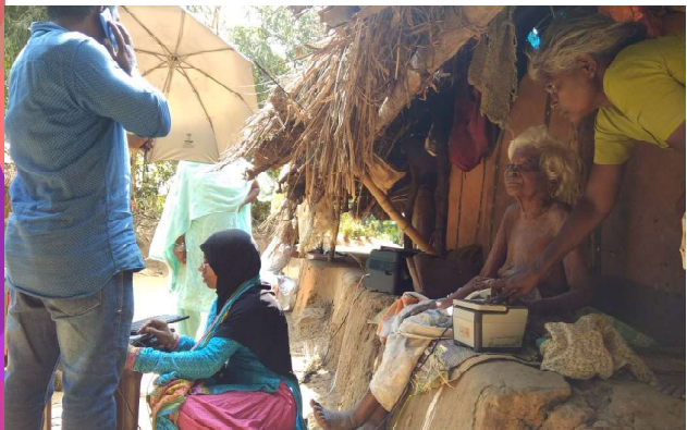
വയനാട് ജില്ലയിലെ കോൽപ്പാറ, അമ്പുകുത്തി എന്നീ കോളനികളിൽ ആധാർ എൻറോൾമെന്റ് നടക്കുന്നു.