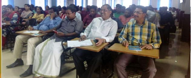
പത്തനംതിട്ട : ജിയോ മാപ്പിംഗ് പരിശീലനം