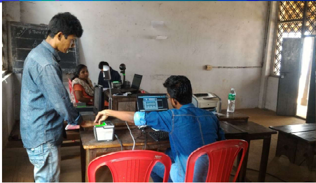
എറണാകുളം: അന്യസംസ്ഥാന തൊഴിലാളികളുടെ ആധാർ എൻറോൾമെന്റ്

റിപ്പോർട്ടുകളും രചനകളും ന്യൂസ് ലെറ്ററിൽ ഉൾപ്പെടുത്തുന്നതിലേക്ക് ജില്ലാതലത്തിൽ നടക്കുന്ന പരിപാടികളുടെ റിപ്പോർട്ടും ഫോട്ടോയും newsletteraspo@gmail.com എന്ന മെയിൽ ഐഡിയിലേക്ക് അയച്ചുതരേണ്ടതാണ്.