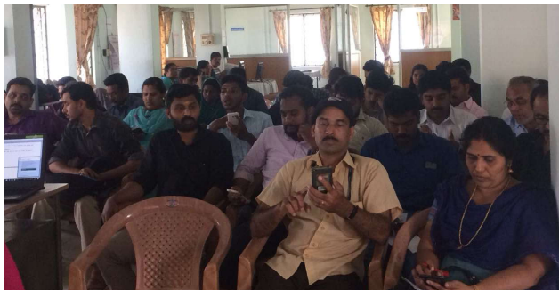
പാലക്കാട് : കെ-ഫോൺ-ജിയോ മാപ്പിംഗ് പരിശീലനം