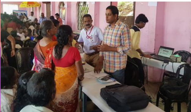
പത്തനംതിട്ട : സ്പെഷ്യൽ ആധാർ ക്യാമ്പ്