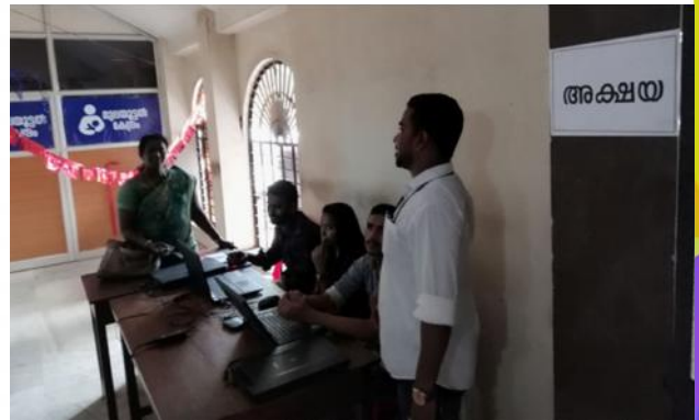
മലപ്പുറം : പരാതി പരിഹാര അദാലത്തിൽ അക്ഷയ