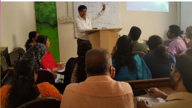
എറണാകുളം : സ്പെഷ്യൽ ആധാർ ക്യാമ്പ്