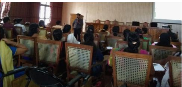
ഇടുക്കി : ടെക്നിക്കൽ ട്രെയിനിംഗ്