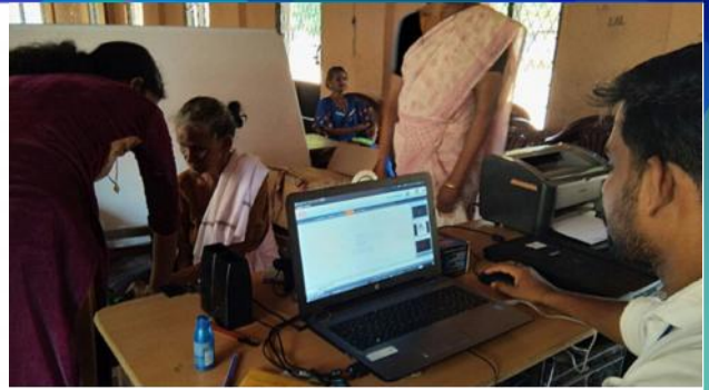
തൃശ്ശൂർ : സ്പെഷ്യൽ ആധാർ ക്യാമ്പ്

ന്യൂസ് ലെറ്ററിൽ ഉൾപ്പെടുത്തുന്നതിലേക്ക് ജില്ലാതലത്തിൽ നടക്കുന്ന പരിപാടികളുടെ റിപ്പോർട്ടും ഫോട്ടോയും newsletteraspo@gmail.com എന്ന മെയിൽ ഐഡിയിലേക്ക് അയച്ചുതരേണ്ടതാണ്.